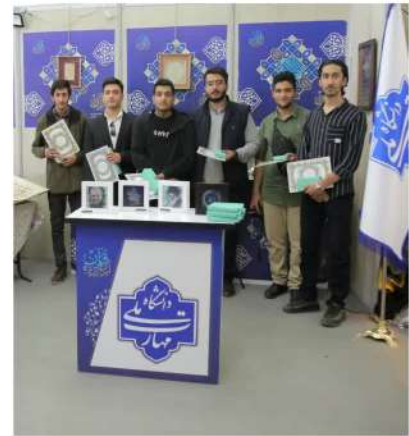
تقدیر از فعالین قرآنی دانشجویان دانشکده شهید شمس‌پور تهران

۲ اسفندماه ۱۴۰۴ (مصاحف یا سوم ماه مبارک رمضان)